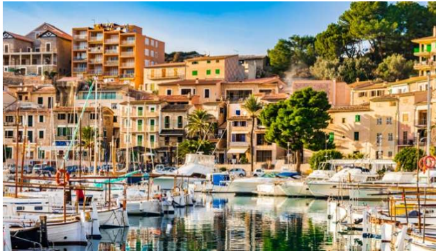
DAG 6: 28 APRIL