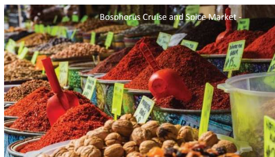
Bosphorus Cruise and Spice Market -